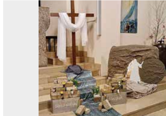
Kirche St. Maria Ostern 2024